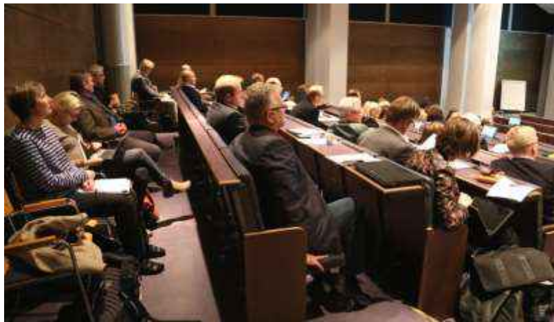
HINKU-syyspäivä 4.10.2016.