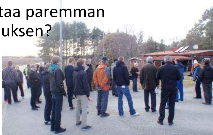
Kuva kevään 2013 Open Homes- tapahtumasta ja aurinkokeräimistä Mynämäeltä